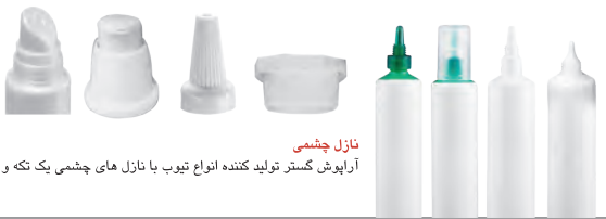
نازل چشمی آراپوش گستر تولید کننده انواع تیوب با نازل های چشمی یک تکه و دو تکه